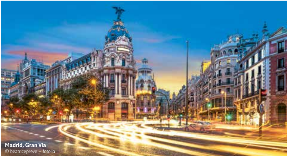
Madrid, Gran Vía